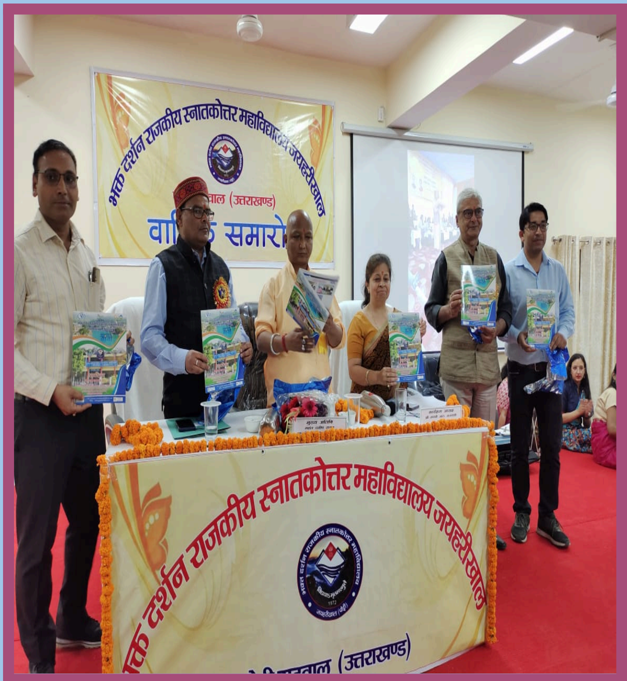
Bhakt Darshan Govt P.G.College Jaiharikhal ,Pauri Garhwal ,Uttarakhand