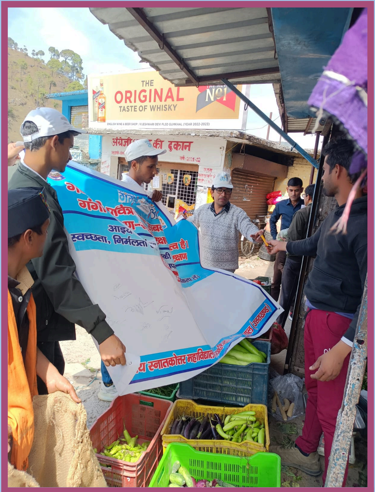
Bhakt Darshan Govt P.G.College Jaiharikhal ,Pauri Garhwal ,Uttarakhand