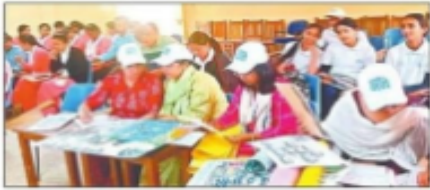
स्लोगन प्रतिस्पर्धा में प्रतिभाग करती छात्राएं। आर.एस.