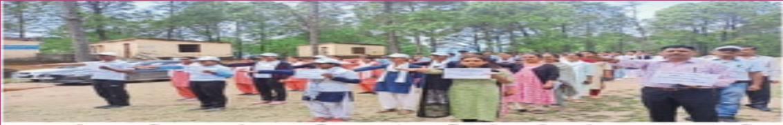
भक्त दर्शन राजकीय स्नातकोत्तर महाविद्यालय में नमामि गंगा कार्यक्रम के तहत स्वच्छता की शपथ ग्रहण करते छात्र • जागरण