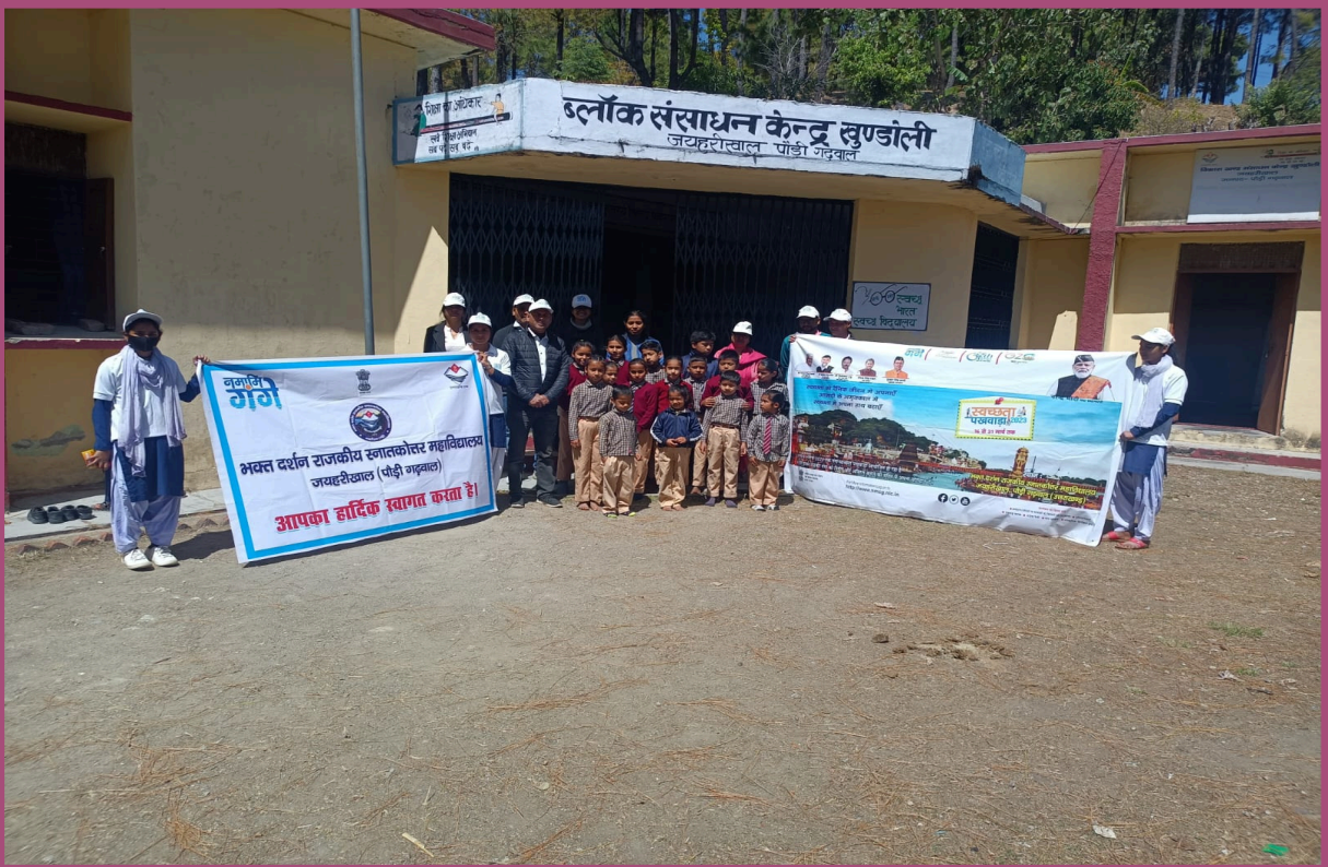
Bhakt Darshan Govt P.G.College Jaiharikhal ,Pauri Garhwal ,Uttarakhand