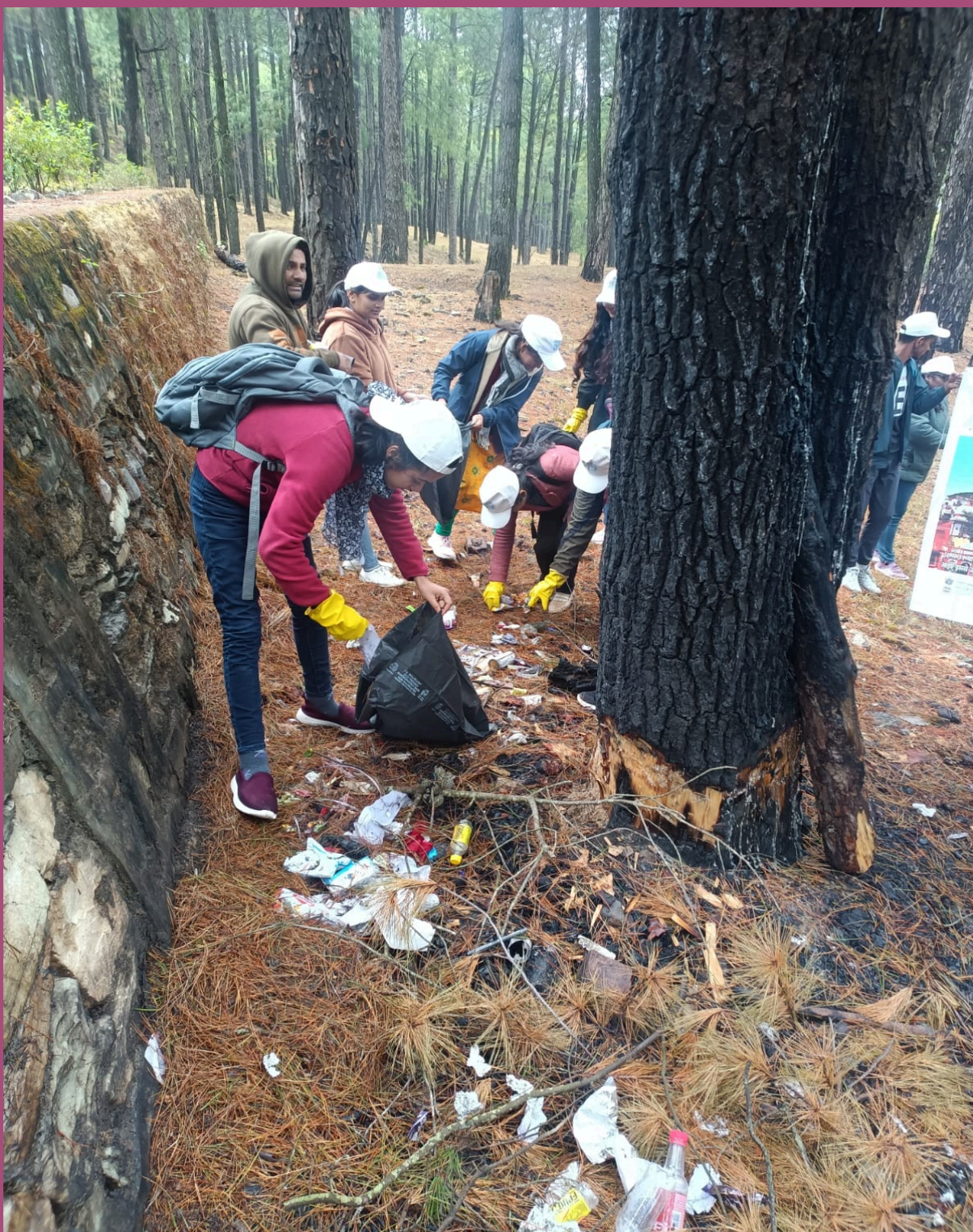
Bhakt Darshan Govt P.G.College Jaiharikhal ,Pauri Garhwal ,Uttarakhand