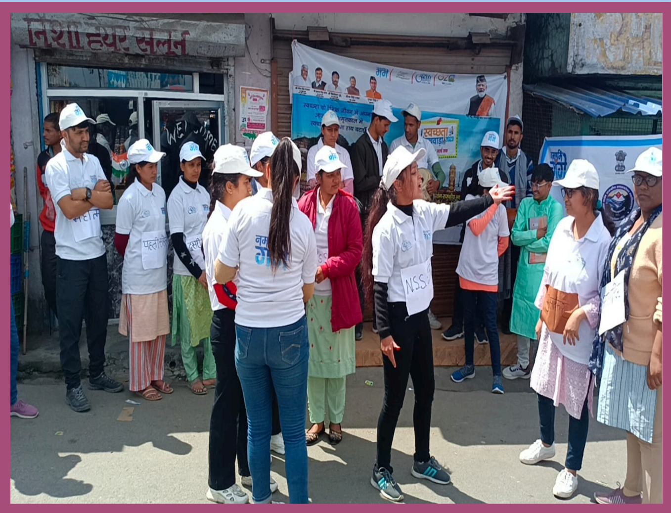
Bhakt Darshan Govt P.G.College Jaiharikhal ,Pauri Garhwal ,Uttarakhand