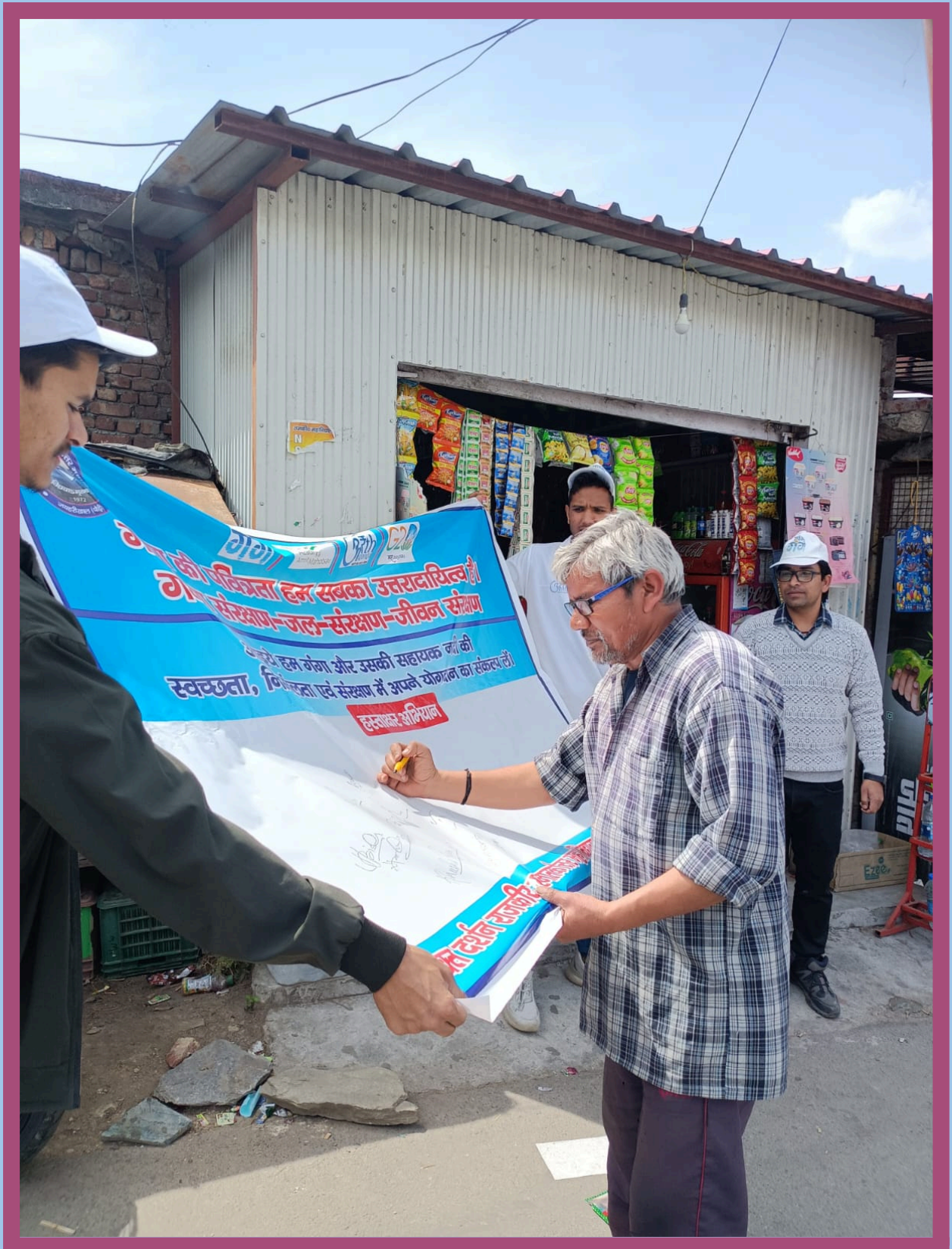
Bhakt Darshan Govt P.G.College Jaiharikhal ,Pauri Garhwal ,Uttarakhand